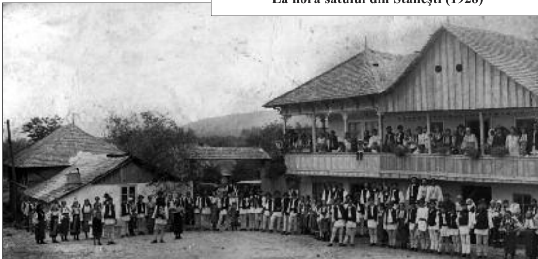
La hora satului din Stănești (1928)

N-au lipsit nici vestitele hore sătești, separat la fiecare localitate învecinată comunei noastre, la care vestitele tarafuri de lăutari încântau audiența. Iar seara, până aproape de ivirea zorilor, erau organizate baluri celebre, la care participau perechile de tineri căsătoriți, flăcăi cu armata făcută și fetele de măritat, acestea însoțite numai de mamele sau frații lor.