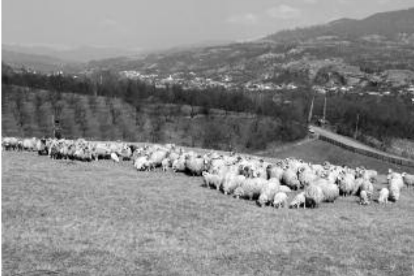
Turma de oi din Corbi

desfășurate de părinții lor ci, după puterile lor, au efectuat munci în gospodăriile părinților, formându-se încă de mici pentru muncă și viață.